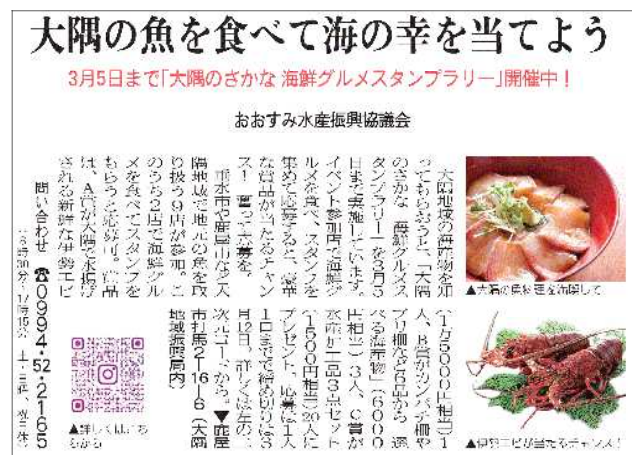
図5 メディア掲載 リビングかごしま (R5. 2. 18号)