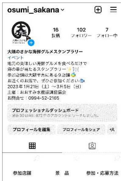
図4 事務局SNS (Instagram, LINE, Facebook)